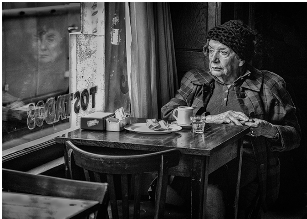
Bar Británico(Claudio Larrea)